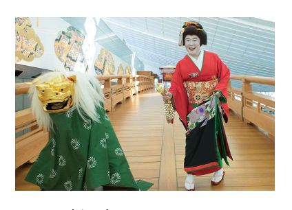
福を広める OFUKU と 新年の験を担ぐ金獅子登場!